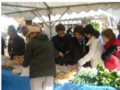
地元の特産品販売