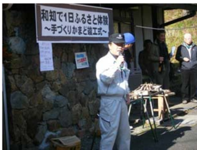
地元上栗野区梅原区長 さんのごあいさつ