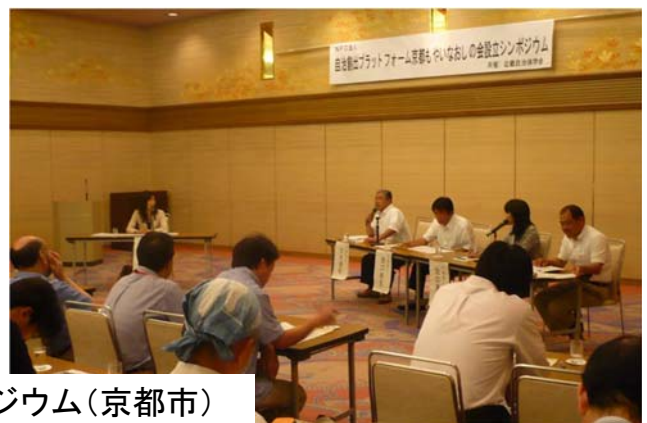
設立記念シンポジウム(京都市)