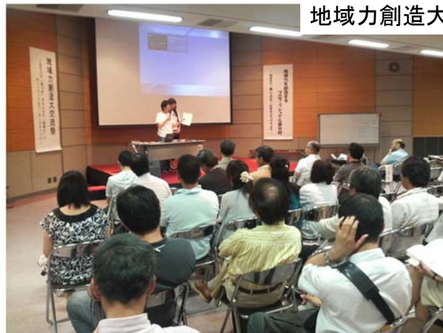
地域力創造大交流祭(立命館BKC)