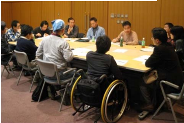
設立総会後のミーティング(舞鶴)